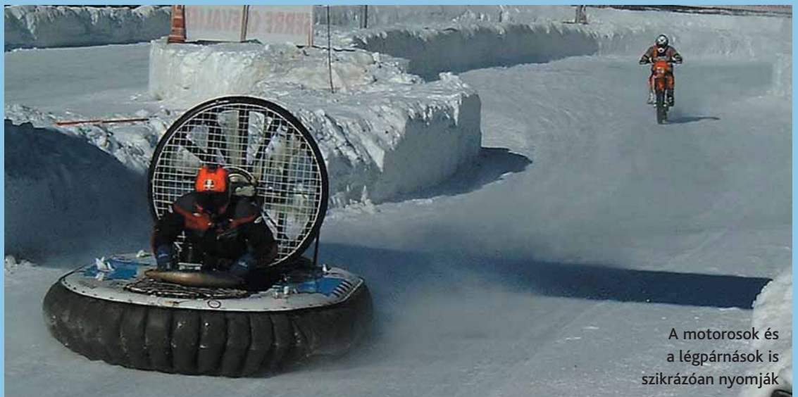
A motorosok és a légpárnások is szikrázóan nyomják

A hölgyek nem csupán versenyruhában mutatósak