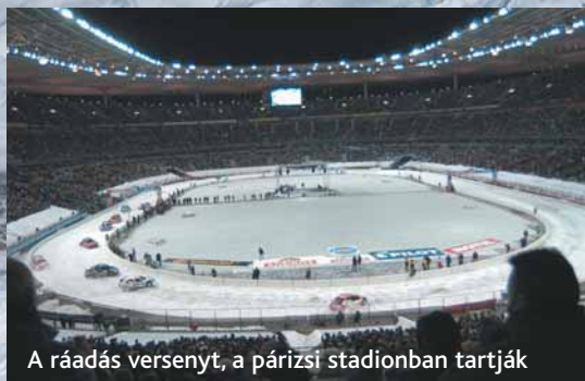
A ráadás versenyt, a párizsi stadionban tartják