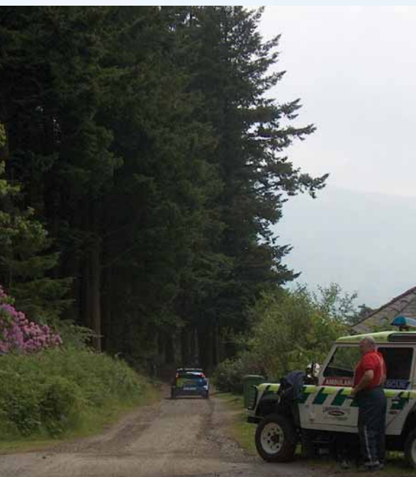
Az út eleje. A „visszafogottság” csak a negyedik fág tartott

Szóval, képzeljenek el egy olyan erdei ösvényt, amely a klasszikus brit pályákat testesíti meg, hegyre fel és le, farakásokkal, szakadékkal és helyenként nagyobb sziklákkal, mindezt csaknem 6 kilométer hosszban. A pálya elején egy tökéletesen kiépített szervizponton, ahol két autó, sok-sok szerelő és a talpig „díszbe” öltözött pilóták vártak. (Természetesen volt gyorsbeavatkozó és mentőautó is.) Általában nem vagyok beszári típus, de miközben a tűzálló maszkot és a sisakot a fejembe nyomták, úgy éreztem, bennem is átrendeződnek a szervek, a szívritmus-szabályozásom pedig egyre rosszabbodott. A kényes helyzetre tett egy lapáttal, hogy Gronholm éppen indult egy körre, s a látótávolságon belüli negyedik óriásfenyőnél lévő jobbosba már úgy érkezett, mint aki épp a Sebastien Loeb elleni legnagyobb csatáját vívja.