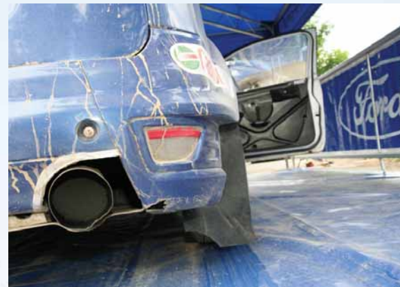
Ezt azért nem mind mi pusztítottuk le