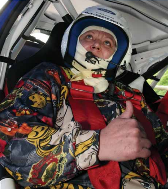
Kicsit bizonytalanul jeleztem, hogy minden rendben