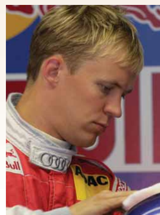
Ha raliról van szó, Mattias Ekström ugrásra kész

nek valóban a német futamon van legnagyobb sánca. Igen ám, de a Citroen saját hivatalos ralis visszatérését is a C4-gyel kívánja ünnepelni, amire ugye a 2007-es szezonnyitó Monte-Carlóig kéne várni. Az biztos, hogy a C4 lassan egy éve tökéletesen bevetésre készen áll, még akkor is, ha a „használati engedély”, azaz a FIA homologizációja július elejéig sem látott napvilágot. Igaz, a titkok őrzése érdekében a gyártók csak az utolsó pillanatban kezdeményezik a hivatalos eljárást, s miután a nevezésben megadott versenyautót a kategórián belül a géptávtelivel lehet cserélni, így lapzártánkör még nem derült ki, hogy valójában Sebastien Loeb milyen géppel jelentkezik majd.