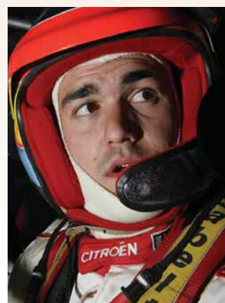
Daniel Sordo a bajnoki tabella stabil harmadikja