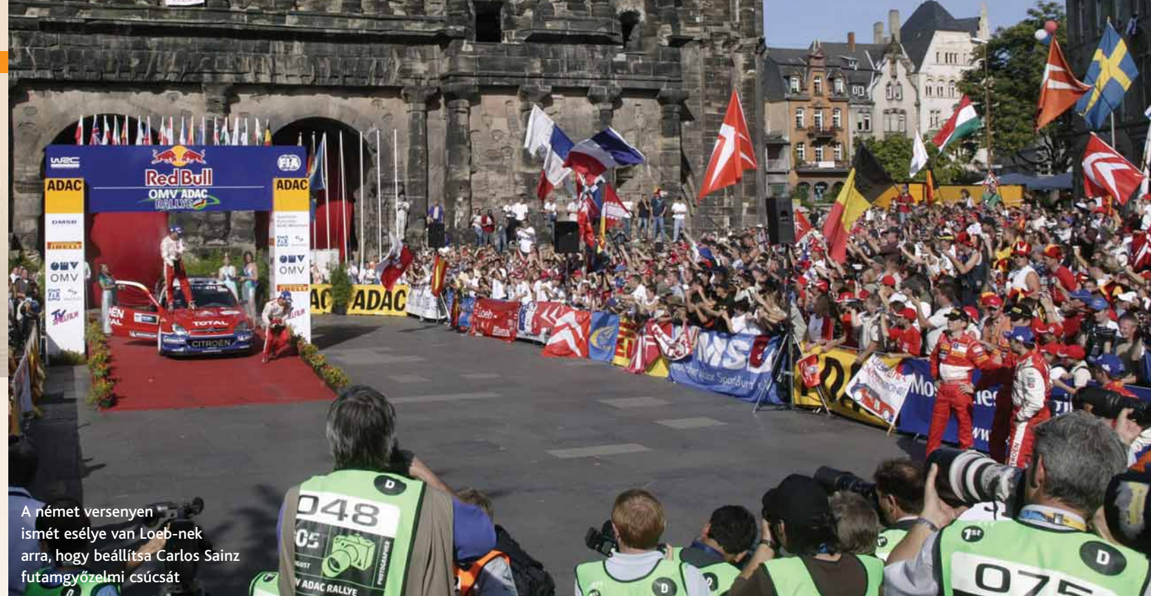
A német versenyen ismét esélye van Loeb-nek arra, hogy beállítsa Carlos Sainz futamgyőzelmi csúcsát

Dani eddig is a Kronos autójával futott, ám az talán már előre vetítheti a jövőt, hogy Sordo a C4 tesztprogramjába is bekapcsolódott. (Sordo mellesleg tavaly a JWRC kategóriában nyerte toronymagasan a német versenyt.) Ralis körökben egyébként a Citroen autótátlásának, azaz a C4 tervezettnél előrébbhozott bevetésének pletykája is szárnyra kapott. Az érvek igen meggyőzőek, hiszen a franciák szeretnék, ha az új autó győzelemmel kezdene és papírforma szerint en-